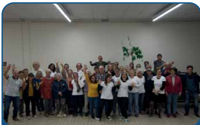
Bénévoles et Exposants

Je suis très heureuse de vous avoir eus avec moi tout le long du week-end, j'espère vous revoir aussi nombreux l'année prochaine. Afin de clore cet article, je vous laisse découvrir le salon en photos !