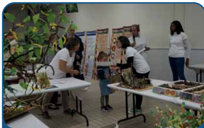
Remise des Lots