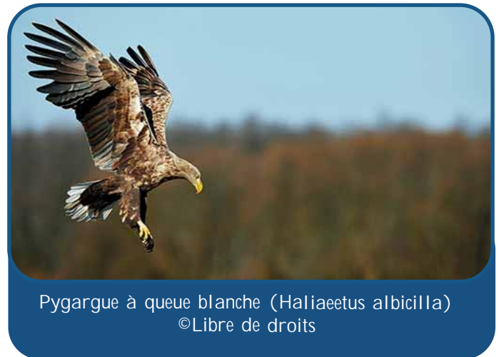
Pygargue à queue blanche ( Haliaeetus albicilla )

En 2022, un couple de Pygargue à queue blanche, constitué d'un mâle immature 3e année et d'une femelle immature 4ème année, a séjourné pendant au moins cinq mois en Sologne du Loir-et-Cher (Sologne centrale et Sologne viticole) durant le printemps et l'été. La consommation d'une Foulque macroule et d'une Mouette rieuse ( Chroicocephalus ridibundus ) a été observée au cours de leur séjour. La présence discrète mais régulière de ce jeune couple pourrait être les prémices d'une future nidification en Sologne qu'il conviendra de surveiller au cours des années à venir.