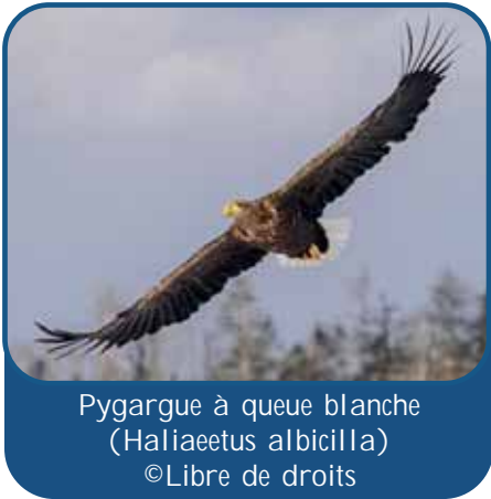
Pygargue à queue blanche ( Haliaeetus albicilla )

Le Pygargue à queue blanche est un grand rapace dont l'envergure est comprise entre 2 mètres et 2,40 mètres, il possède de larges ailes et une courte queue cunéiforme, de couleur blanche chez l'adulte. Son bec massif est jaune, brun noirâtre chez le jeune (Peterson, Mountfort, Hollom et Géroudet, 1984). Il fréquente les zones humides : côtes, lacs, étangs et fleuves (Gensbol, 1999).