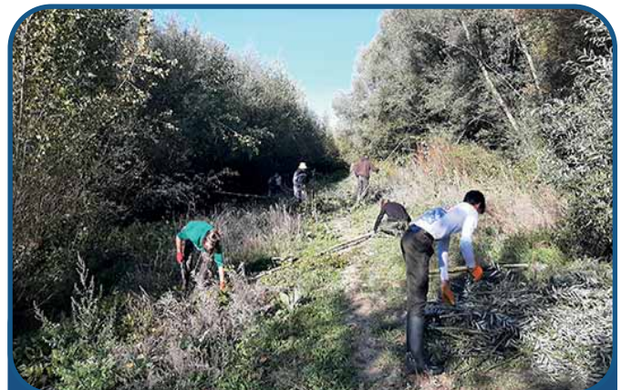
Loutre Team Castor

étudiants ultra-motivés, volontaires et souriants. Ajoutez trois membres de l'équipe salariée de SNE et un bénévole essentiel. N'oubliez pas d'accompagner ce mélange détonant de 3 professeurs passionnés. Mixez l'ensemble avec des pieux en saule, des rondins, et des branchages. Au bout de 5 heures de travail, dans la bonne humeur et en toute sécurité, vous obtiendrez de magnifiques refuges pour la Loutre !