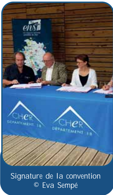
Signature de la convention

Reconnu comme étant le plus grand étang de la Sologne, le site de l'étang du Puits abrite de nombreuses espèces patrimoniales, notamment les oiseaux nicheurs. Partagé entre les départements du Cher et du Loiret, le site est classé en Espace Naturel Sensible (ENS) dans les deux départements. Depuis de nombreuses années, les bénévoles du groupe ornithologique de Sologne Nature Environnement conduisent annuellement des recensements des oiseaux aquatiques. L'association réalise aussi ponctuellement des inventaires d'autres groupes faunistiques. En 2021, sur demande des deux Conseils départementaux, nous avons rédigé un plan de gestion pour l'ensemble du site.