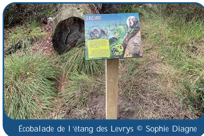
Écobalade de l'étang des Levrys