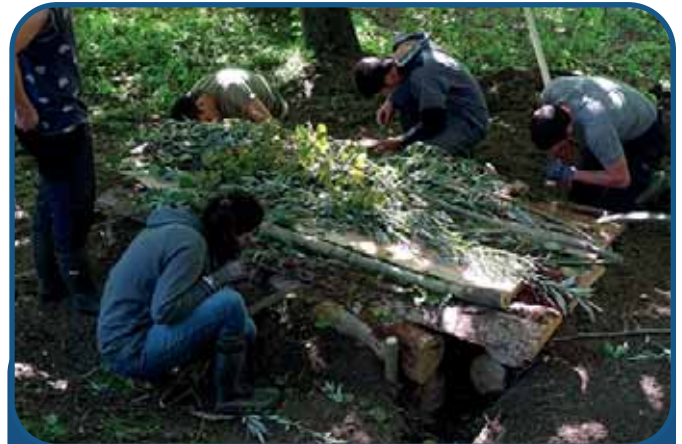
Loutre Team Blaireau

La recette pour construire des catiches en Sologne est donc la suivante : prenez 28 (nombre pas en fin de ligne)