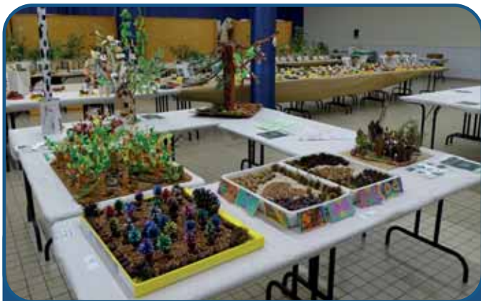
Oeuvres du concours scolaire © Michel Roubalay

Concours scolaire, un jeu à destination des enfants sur le salon et une projection-débat ont été articulés autour de ce thème très actuel, étant donné l'été caniculaire et la sécheresse de l'été dernier.