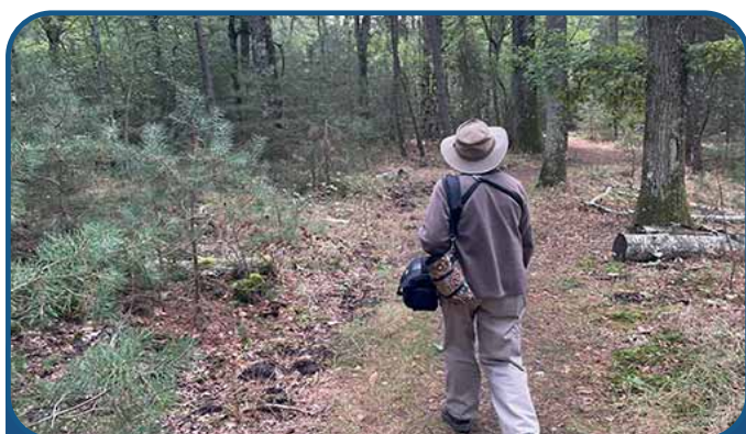
Écobalade de l'étang des Levrys

Ainsi, dès 8 heures, accompagnée d'Éva, chargée d'étude de notre association et équipées de nos plans, d'une tablette tactile et de notre bonne humeur, nous nous sommes accordées sur le projet avec le chef de chantier.