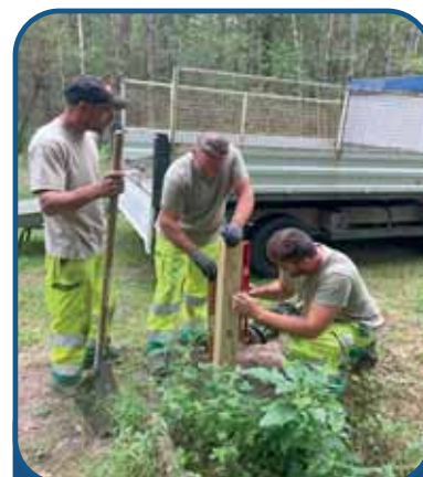
Écobalade de l'étang des Levrys

Sophie Diagne, Service Civique Volontaire en Communication.