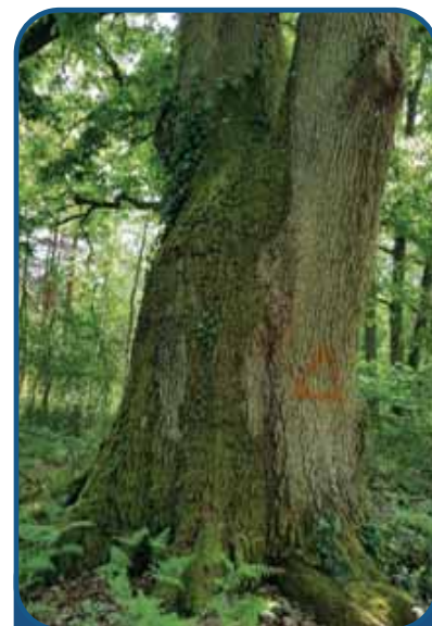
Gros Chêne présent dans la Forêt du Cher

Nous espérons que la libre évolution des forêts du site sera favorisée par le gestionnaire, en dehors des zones d'accès au public, comme des aires de pique-nique et le long des chemins de randonnée. Les zones sont d'une assez grande surface pour présenter déjà une naturalité élevée de par la maturité des arbres et la présence de bois mort en sous-bois.