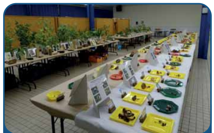
Expositions Champignons, Arbres & Fruits Sauvages

Pour ce salon, nous avons choisi le thème de « La forêt et le changement climatique ». Ce thème est un thème très actuel étant donné l'été caniculaire et la sécheresse qu'il y eut cet été, en 2022.