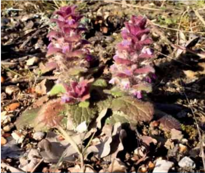
Bugle pyramidal [Ajuga pyramidalis L., 1753] – © Maurice Sempé, 2023