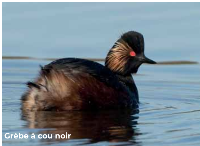
Grèbe à cou noir

Rousserolle turdoïde : Progression de l'espèce avec 6 chanteurs sur le site classique de Cerdon-du-Loiret, contre 3 en 2022 (peut-être due à une meilleure prospection ?).