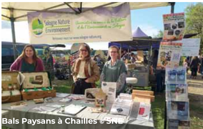
Bals Paysans à Chailles

Si nous nous tournons vers les réseaux sociaux, notre communauté a également grimpé que ce soit sur Facebook ou Instagram, nous avons gagné 236 followers sur Facebook et 173 sur Instagram. Ce qui représente une communauté de 8 448 followers sur Facebook et 1 516 sur Instagram. Sologne nature Environnement vit des jours meilleurs et tout cela, c'est simplement et uniquement grâce à vous. Alors merci et vivement la saison 2024 !