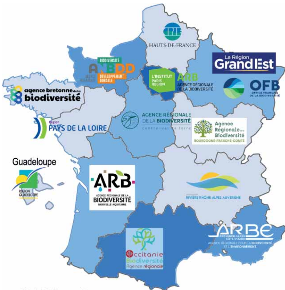
Nb de TEN par région

La troisième Stratégie nationale biodiversité 2030, récemment publiée , vise à amplifier ces programmes.