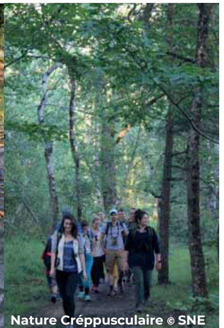
Nature Crépusculaire