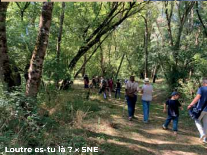
Loutre es-tu là ?