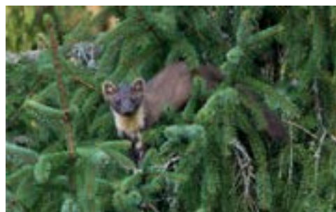
Martre des pins (Martes martes)

Ainsi, statistiquement, tuer plus d'animaux ne réduit pas les dégâts l'année suivante . Dans certaines régions, la relation est même inversée : plus on détruit une espèce une année donnée, plus les dégâts sont élevés l'année suivante, notamment pour les geais et les étourneaux. Cela ne signifie pas que la destruction provoque directement les dégâts, mais cela suggère encore une fois qu'elle ne les empêche pas.