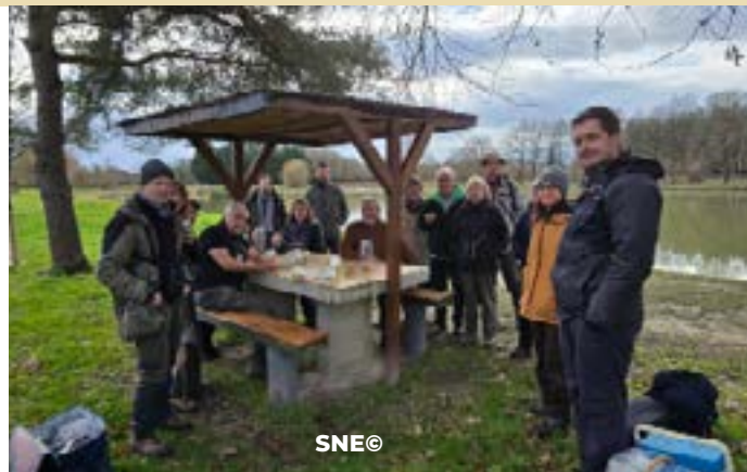
Photo de l'Équipe SNE WETLANDS 2026

Un journaliste nous a accompagné en matinée et un article intitulé « Les oiseaux migrateurs ne viennent plus » a été publié le 19 janvier dans le journal la Nouvelle République.