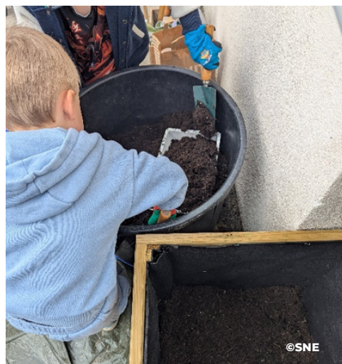
Pot à remplir pour accueillir la bignone

Le second atelier, c'était plantation avec maitresse : Pour les petites sections, il fallait planter une bignone dans un pot situé dans la cour, et les enfants devaient donc chacun remplir le pot de terre. Ils avaient également une graine de courge à planter dans un petit pot.