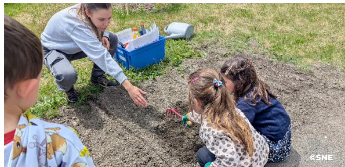
... également inspecteur des travaux finis...

Le second atelier, c'était plantation avec maitresse : Pour les petites sections, il fallait planter une bignone dans un pot situé dans la cour, et les enfants devaient donc chacun remplir le pot de terre. Ils avaient également une graine de courge à planter dans un petit pot.