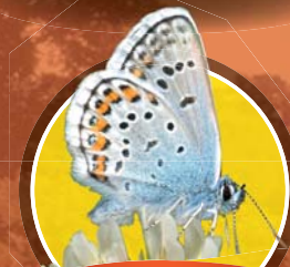
Azuré de l'ajonc

L'Engoulevent est un oiseau nocturne qui choisit le plus souvent la bruyère pour installer son nid. Il est un maître du camouflage, mais il produit en vol un son de crécelle qui s'entend le printemps au crépuscule.