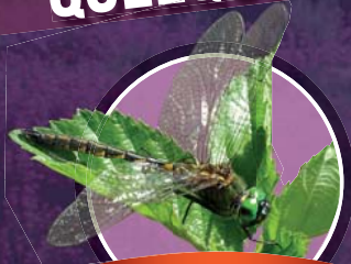
Cordulie à tâches jaunes

Cette espèce de libellule d'une grande rareté fréquente préférentiellement des landes et marais tourbeux avec une végétation riche en plantes aquatiques.