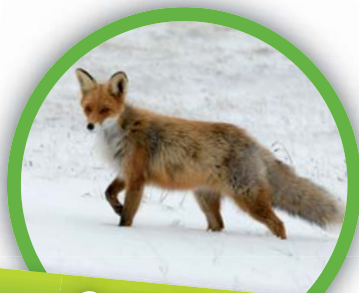
Renard roux ( Vulpes vulpes )