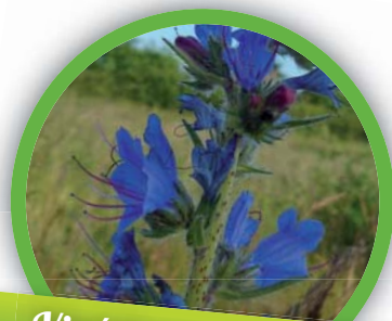
Vipérine commune ( Echium vulgare )