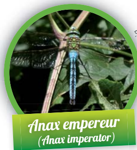
Anax empereur ( Anax imperator )