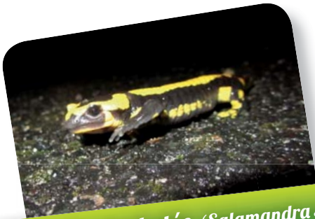
Salamandre tachetée ( Salamandra salamandra )

Consomme des limaces et insectes ravageurs du jardin.