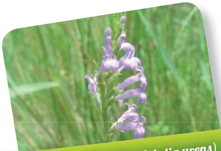
Lobélie brûlante ( Lobelia urens )

Laisser des zones non fauchées au printemps.