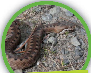
Vipère aspic ( Vipera aspis )