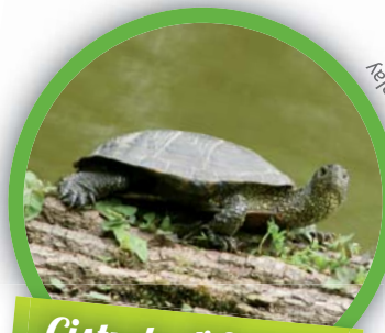
Cistude d'Europe ( Emys orbicularis )