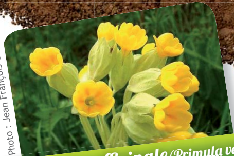
Primevère officinale ( Primula veris )