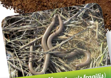
Orvet fragile ( Anguis fragilis )