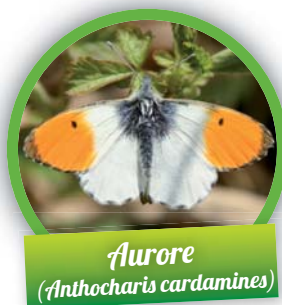
Aurore ( Anthocharis cardamines )