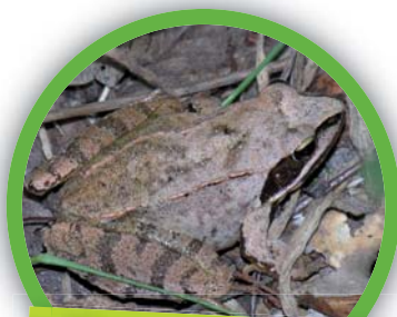
Grenouille agile ( Rana dalmatina )