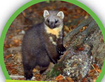
Martre des pins ( Martes martes )