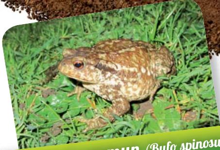
Crapaud commun ( Bufo spinosus )