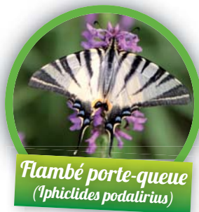
Flambé porte-queue ( Iphiclides podalirius )