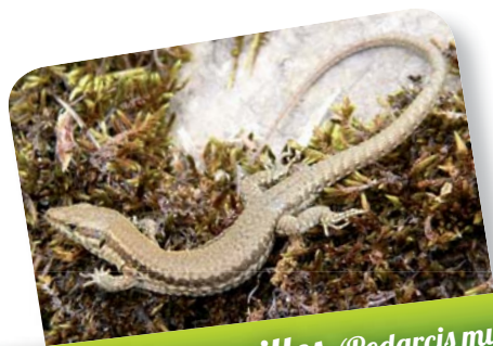
Lézard des murailles ( Podarcis muralis )

Consomme des limaces et insectes ravageurs du jardin.