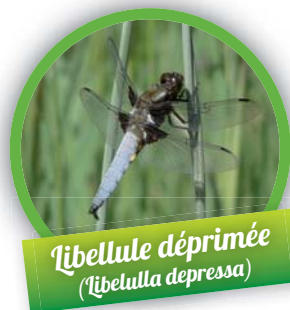
Libellule déprimée ( Libellula depressa )