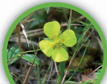
Potentille tormentille ( Potentilla erecta )