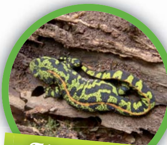
Triton marbré ( Triturus marmoratus )