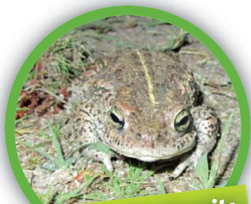
Crapaud calamite ( Bufo calamita )