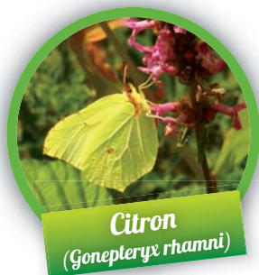
Citron ( Gonepteryx rhamni )