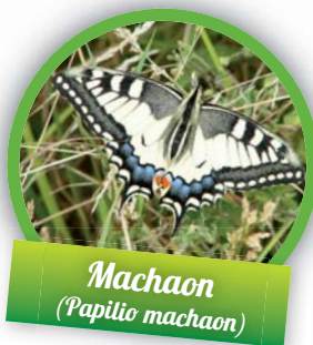
Machaon ( Papilio machaon )