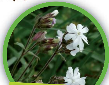
Compagnon blanc ( Silene alba )