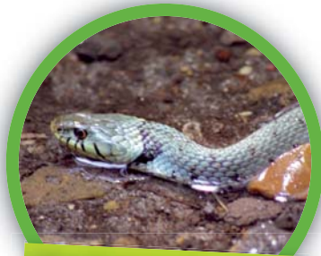
Couleuvre à collier ( Natrix natrix )