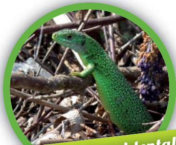
Lézard vert occidental ( Lacerta bilineata )