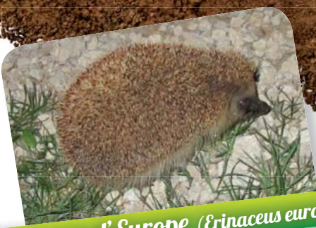
Hérisson d'Europe ( Erinaceus europaeus )