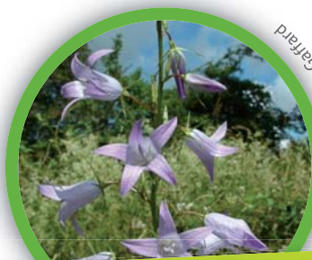
Campanule raiponce ( Campanula rapunculus )