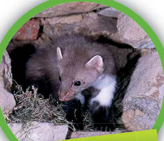
Fouine ( Martes foina )