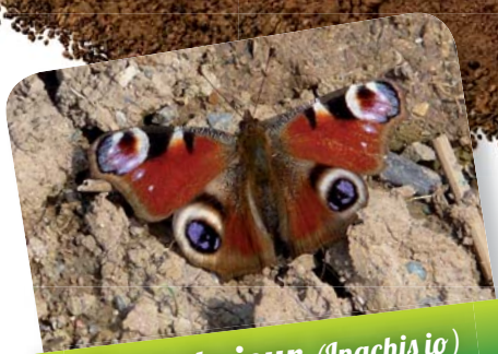
Paon du jour ( Inachis io )