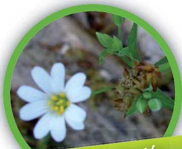
Stellaire holostée ( Stellaria holostea )