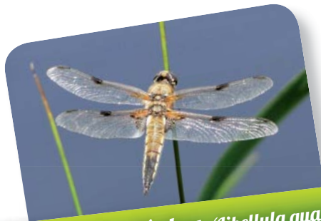
Libellule à quatre tâches ( Libellula quadrimaculata )