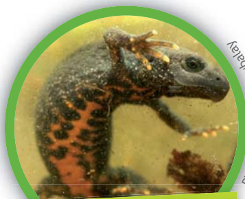
Triton crêté ( Triturus cristatus )