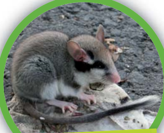
Lérot ( Eliomys quercinus )