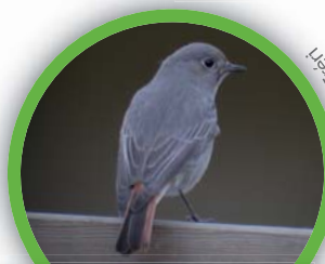
Rougequeue noir ( Phoenicurus ochruros )