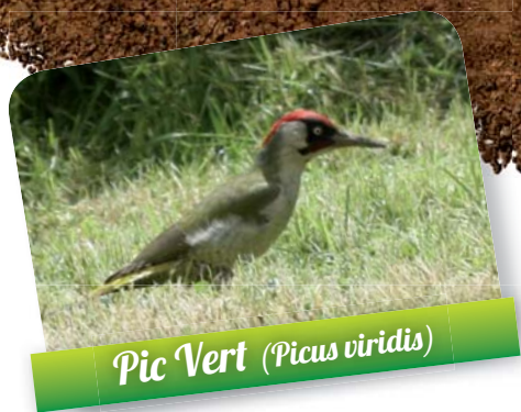
Pic Vert ( Picus viridis )