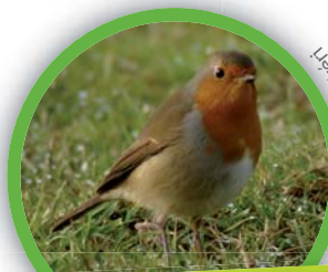
Rougegorge familier ( Erithacus rubecula )