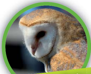
Chouette effraie ( Tyto alba )