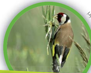
Chardonneret élégant ( Carduelis carduelis )