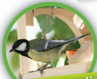
Mésange charbonnière ( Parus major )