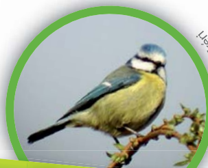
Mésange bleue ( Parus caeruleus )